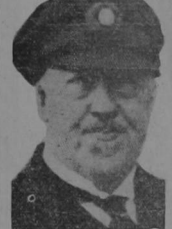
DOCTOR HUGO ECKENER constructor y capitán del gran dirigible