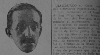
Don Alfonso de Borbón

Los Borbones llevan a cabo conferencias en Niza, en vista de la situación política española