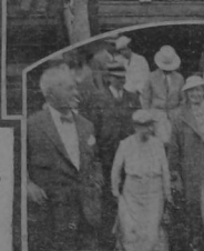
Seventy-one tourists from the United States arrived here yesterday aboard the crack liner VERAGUA of the United Fruit Company. They all enjoyed their trip from Lamon to the capital, and had a most interesting rest stop in Costa Rica. WELCOME!

VON HINDENBURG TO LEAVE FOR EUROPE TODAY RIO DE JANEIRO, 4.—The great dirigible "Von Hindenburg" arrived at Santa Cruz today this morning, after having completed the passage from Germany across the South Atlantic in 100 flying hours. The big ship was moored at 6:20 a. m. and later placed in the big hangar by hand when the morning shift parted. An official reception committee consisting of Brazilian officials and members of the German Embassy welcomed Dr. Hugo Eckener and his gallant crew, and the big ship is scheduled to commence its return journey to Europe tomorrow, Sunday, morning, carrying a considerable number of passengers and mail. It may be that "Von Hindenburg" will make its first